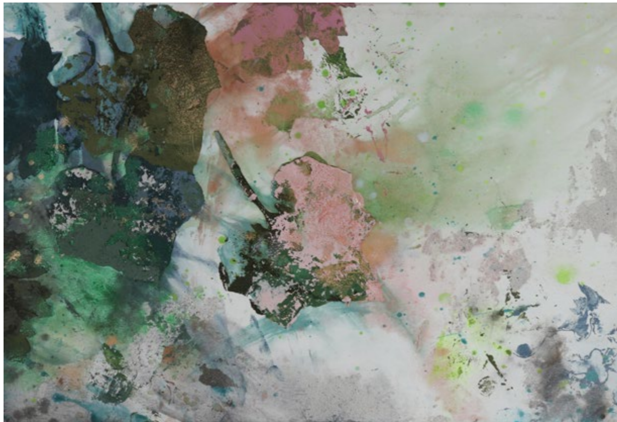
Tsukuba 4h-7h - Technique mixte sur toile - 50 x 73 cm - été 2022