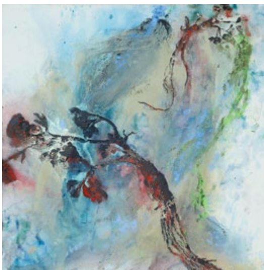
Ranunculus-Ranunculus (Cimes et racines) 180 x 180 cm - 2022

« Si Akira est peintre de lumière, il ne peint pas à la manière des Impressionnistes qui jouent de ses reflets changeants dans l'ici-maintenant d'un paysage ou d'un portrait par des petites touches pures. Il est corps intégrant de cette lumière avec laquelle il entretient une chaude complicité... » Claude Soloy