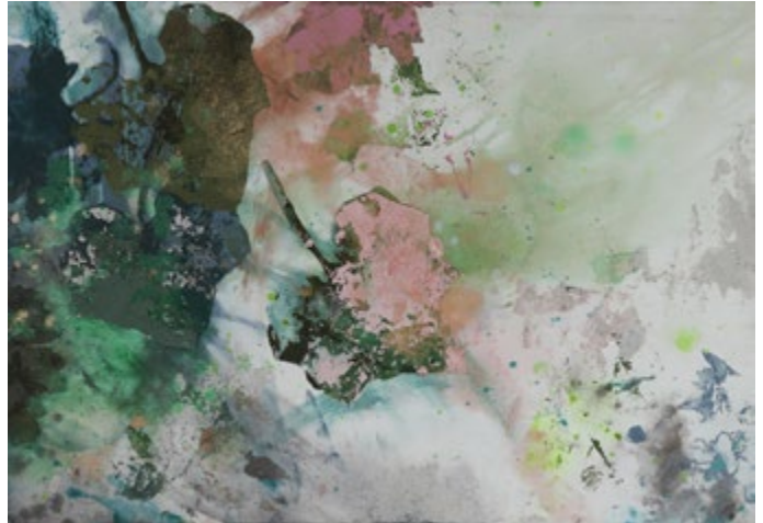
Tsukuba 4h-7h - Technique mixte sur toile - été 2022 - 50 x 73 cm

galerie.terrain.vagh@gmail.com - 06 10 27 50 38 https://galerieterrainvagh.com