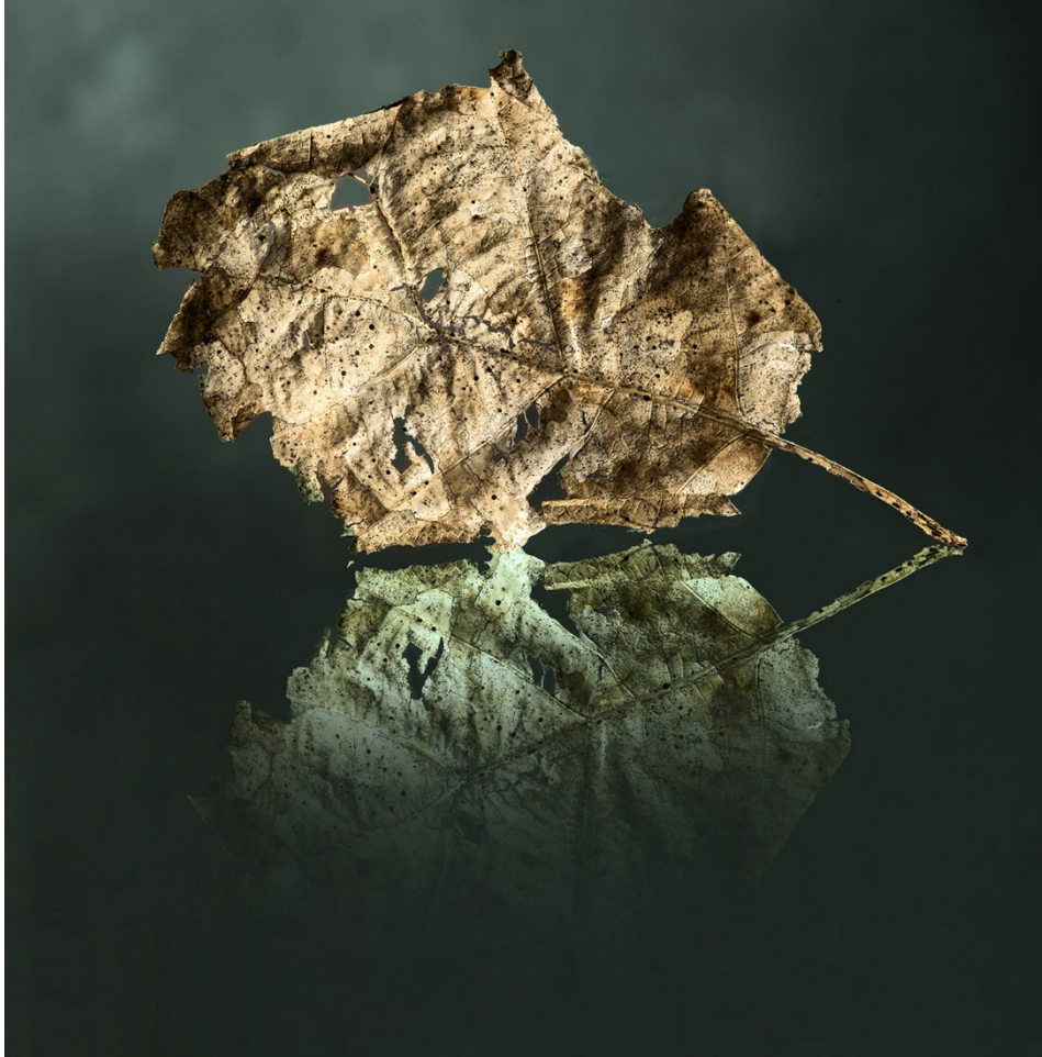
Peinture numérique 1/8 – 130 x 90 cm - 2022