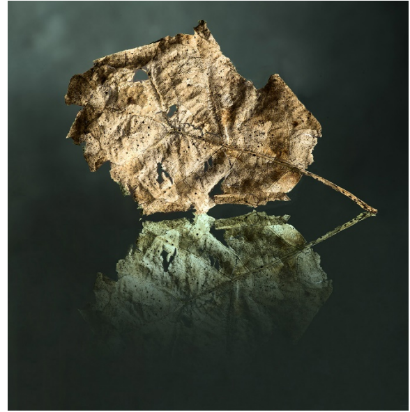
Peinture numérique 1/8 - 90 x 60 cm - 2022

Les Romains célébraient Flora, déesse romaine du printemps, des fleurs et des jardins, durant cinq nuits festives entre avril et mai, afin d'obtenir sa protection pour la fertilité des terres.