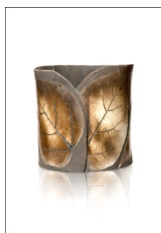
Catalpa I - sculpture 33 x 43 x 32 cm 2021

Rêver la flore, tout en lui conférant une seconde vie esthétique dans un dialogue fertile entre photographie et céramique, telle est l'ambition de l'exposition « FloriRêves » proposée par la Galerie Terrain Vagh du 14 au 28 mai 2022.