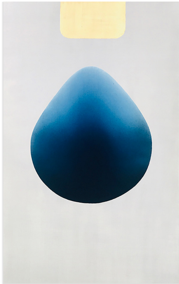
Catherine Ludeau, Lux Aeterna Eve 200 x 122 cm