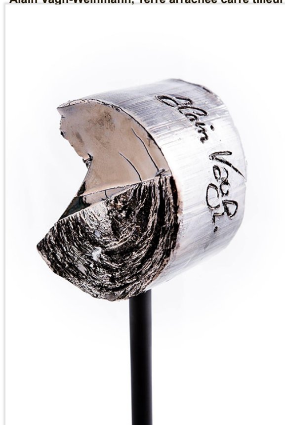
Alain Vagh-Weinmann, Terre arrachée ronde argentée