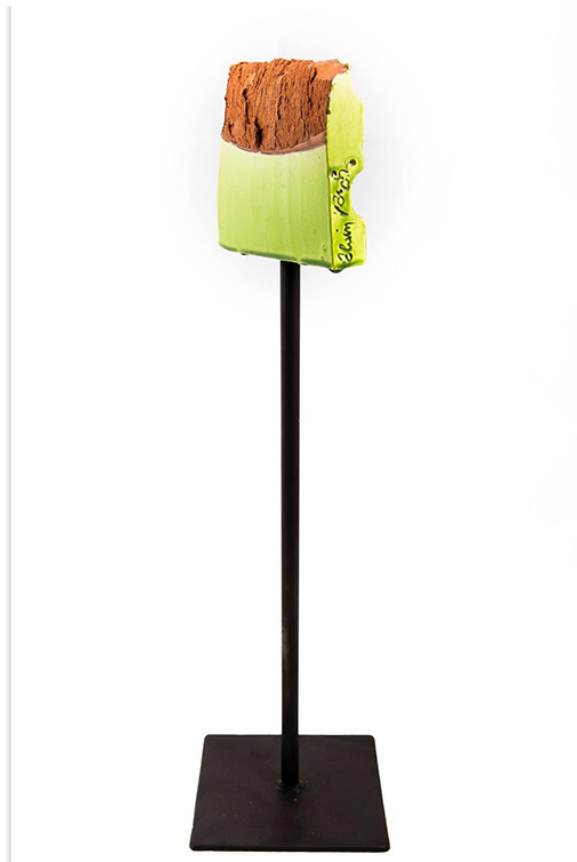
Alain Vagh-Weinmann, Terre arrachée carré tilleul